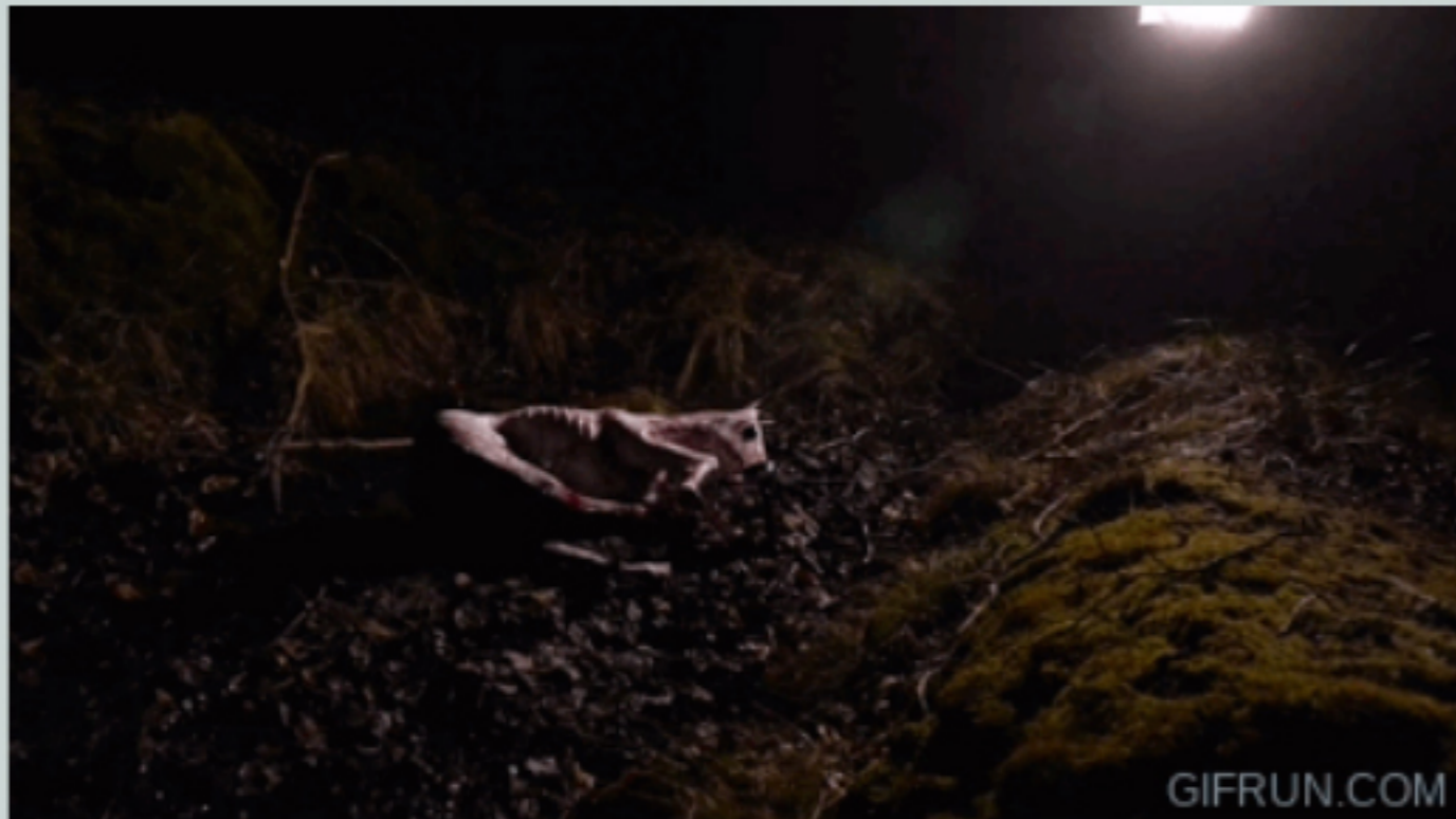
Anetha x UFO95 - Wet For It