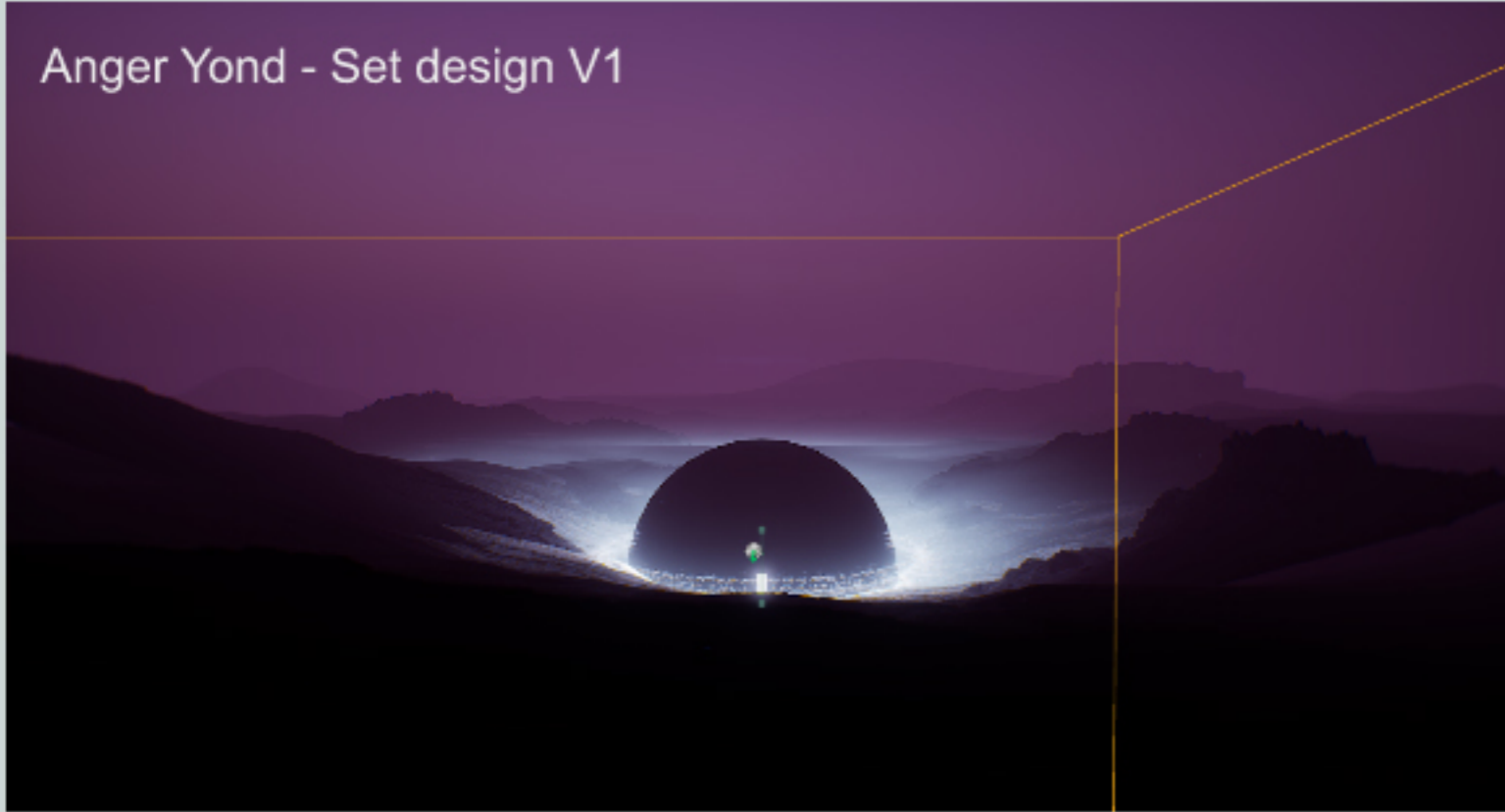
Anger Yond - Set design V1