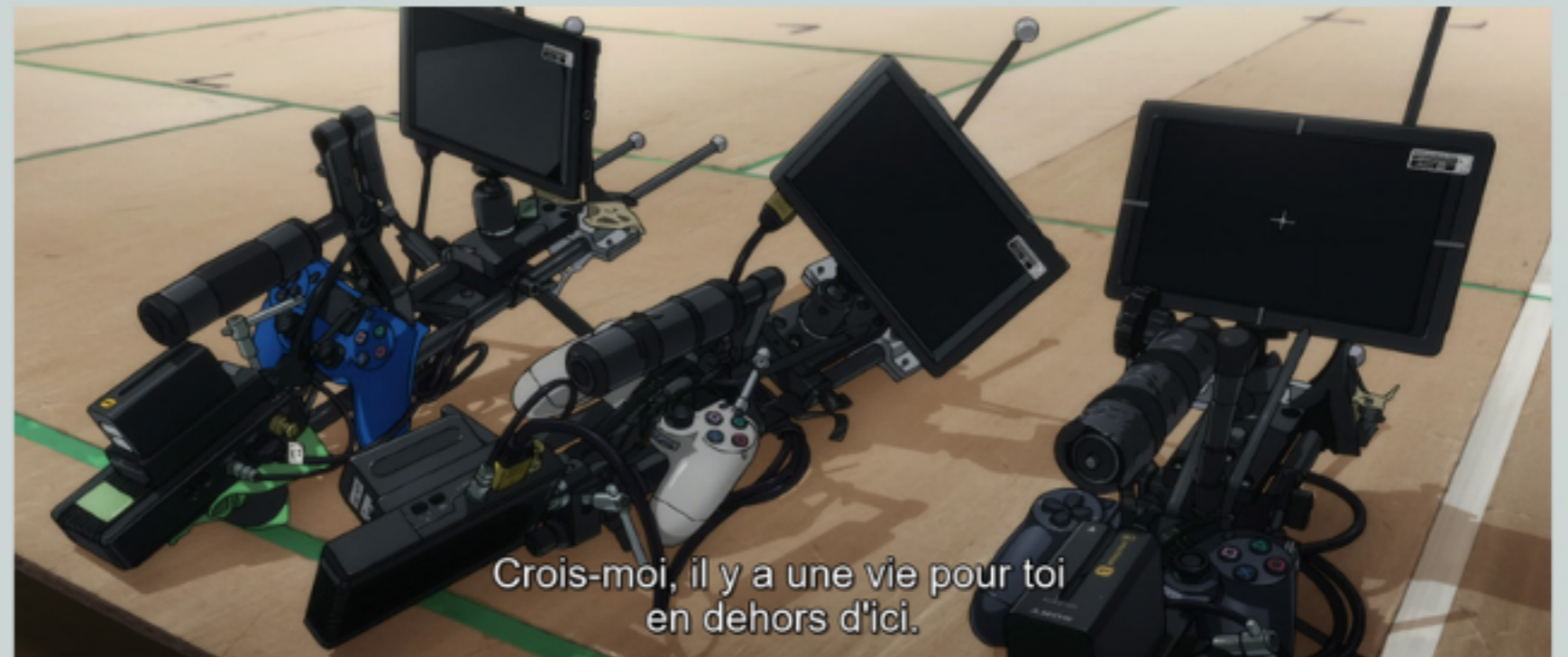
The End of Evangelion